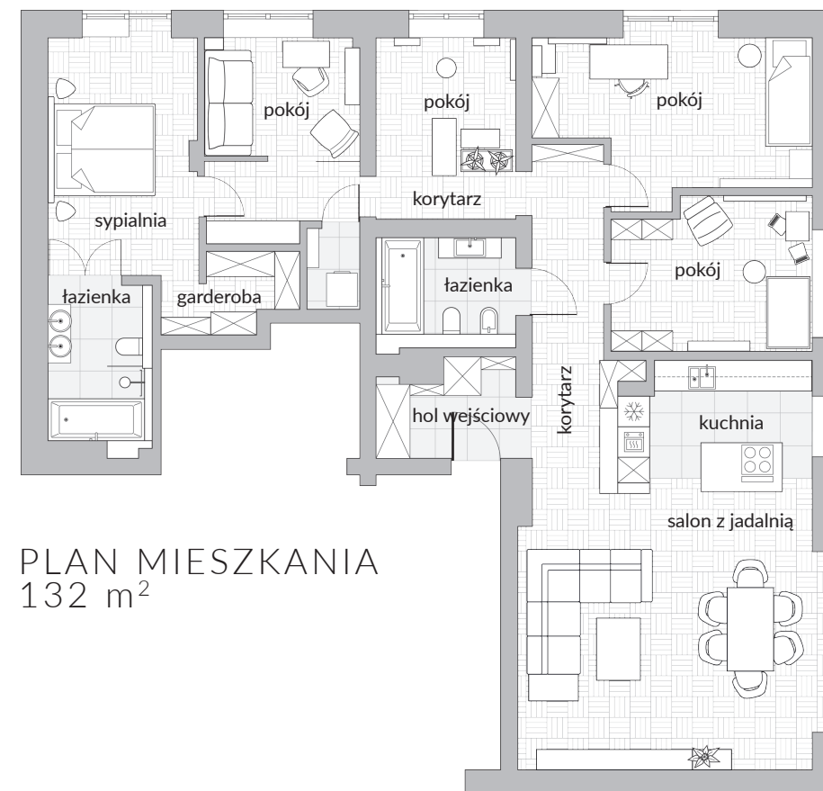
PLAN MIESZKANIA 132 m 2

zadaniem architektki Katarzyny Denst było sprytnie połączenie dwóch mieszkań w estetycznie spójną całość i jednocześnie wydzielenie odpowiedniej ilości potrzebnych pomieszczeń. Ukoronowaniem funkcjonalnie rozplanowanej przestrzeni jest salon z otwartą kuchnią. Reprezentacyjny pokój dzienny jest podzielony na wygodne strefy, w których rodzina gotuje, biesiaduje i odpoczywa.